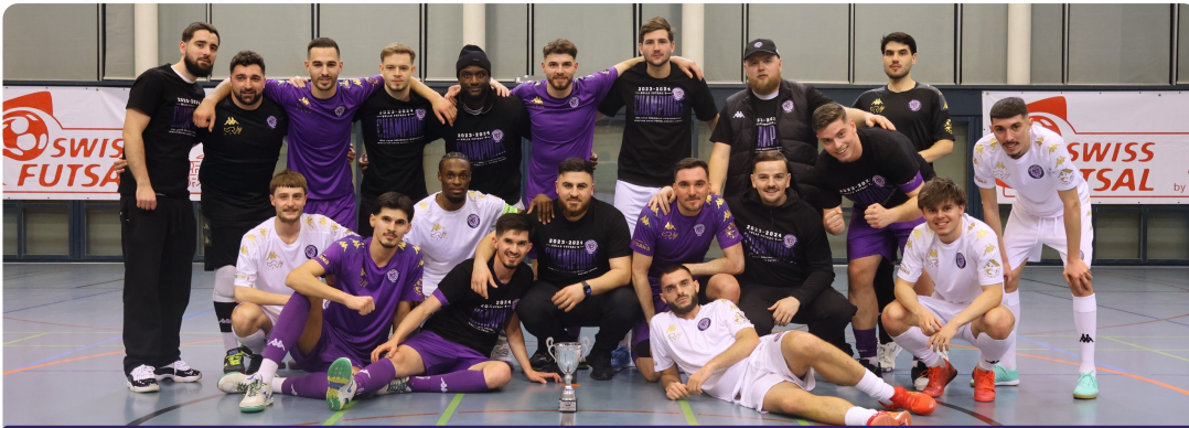
03.03.24 PROMOTION SWISS FUTSAL SECOND LEAGUE