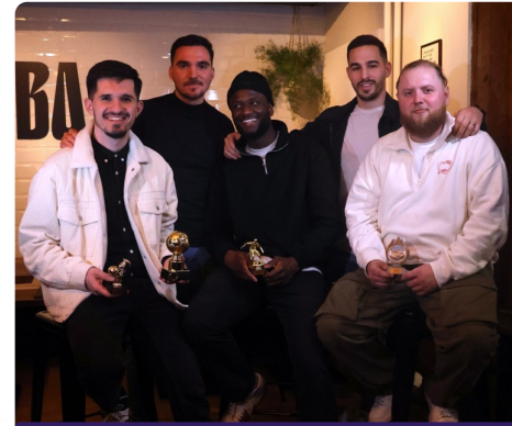
09.03.24 TROPHÉES BFS