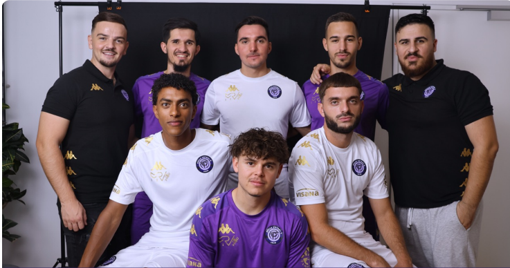
30.09.23 KICK-OFF DÉBUT DE SAISON