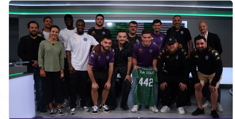
14.04.24 PASSAGE SUR L'ÉMISSION 4-4-2