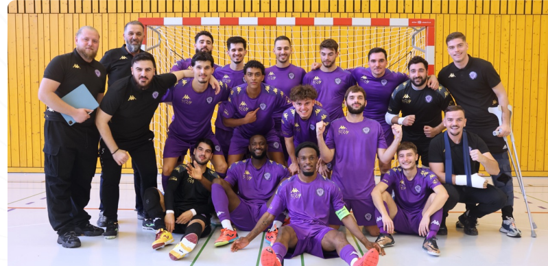
19.11.23 - PREMIÈRE VICTOIRE 6-2 CONTRE AJAX FRIBOURG II