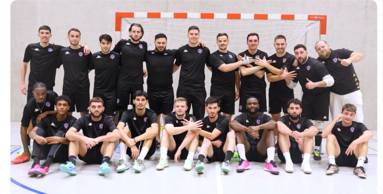
25.01.24 - CHAMPION NÈRE LIGUE RÉGIONALE FRIBOURGEOISE